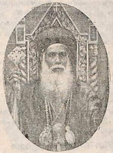
വാകത്താനം വള്ളിക്കാട്ടു യോഗയിൽ കബറടങ്ങിയിരിക്കുന്ന പ. ബസ്സേലിയോസ് ഗീവർഗീസ് പ്രഥമൻ ബാവാ. ഓർമ്മ. ഡിസംബർ 17.